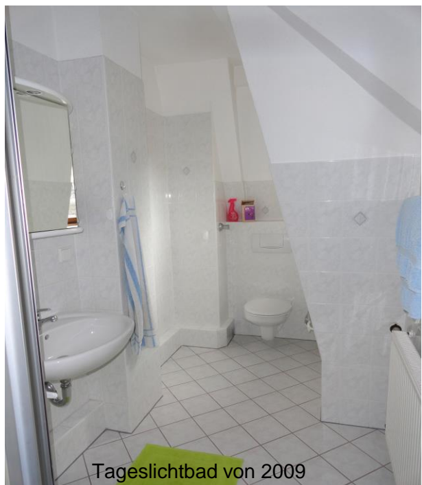
Tageslichtbad von 2009