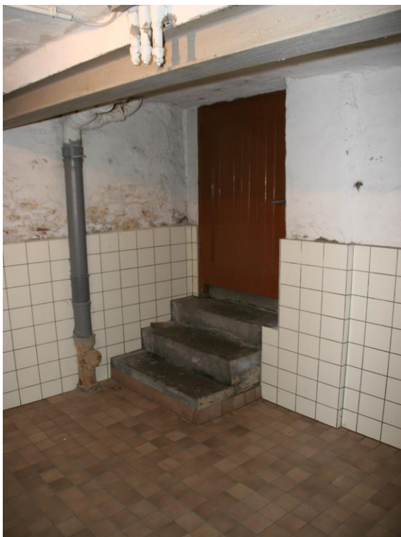
Tür nach draußen vom Wäschekeller