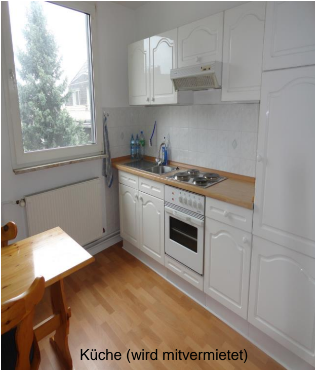
Küche (wird mitvermietet)