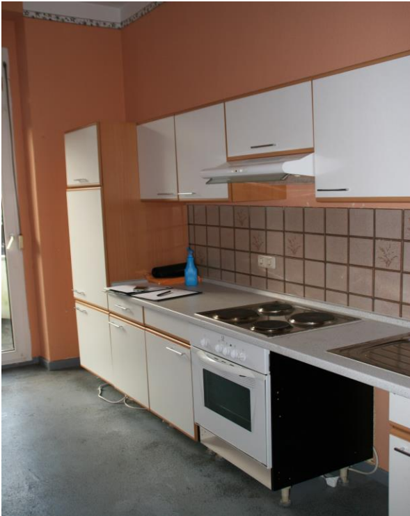
Wohnküche mit Küchenzeile