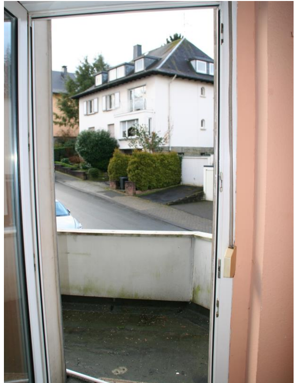
Balkonausgang von Wohnküche aus