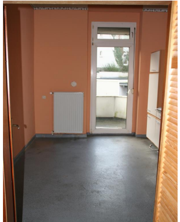
Wohnküche mit Platz für Essplatz