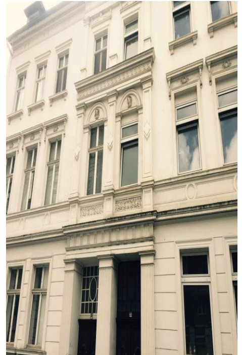
Adresse: Normannenstr. 38 42275 Wuppertal

Das Haus ist zentral aber ruhig gelegen. Der öffentliche Nahverkehr kann fußläufig über Bushaltestellen, die Schwebbahnstation und den Bahnhof Oberbarmen erreicht werden und bietet eine direkte Anbindung an Düsseldorf, Hagen, Essen und Köln. Auch die Autobahnzufahrt liegt nur drei Kilometer entfernt. Nahversorgungsmöglichkeiten für den täglichen Bedarf sind in unmittelbarer Nähe vorhanden.